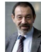
Pr JJ Cassiman