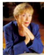
Pr J Kristeva