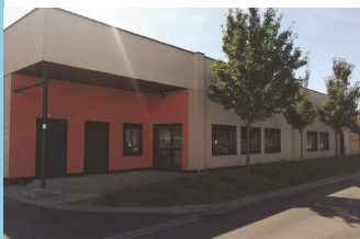
Pharmacie site Lavoisier/Purpan (PCEC/UMFA)