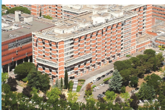
Pharmacie site Rangueil