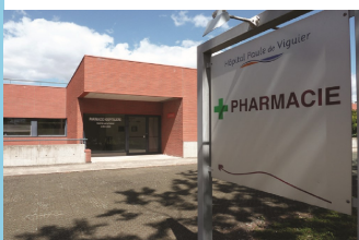
Pharmacie Paule-de-Viguier Site Purpan