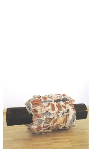
B PAGES - 1976