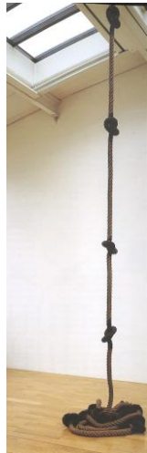
C VIALLAT 1969