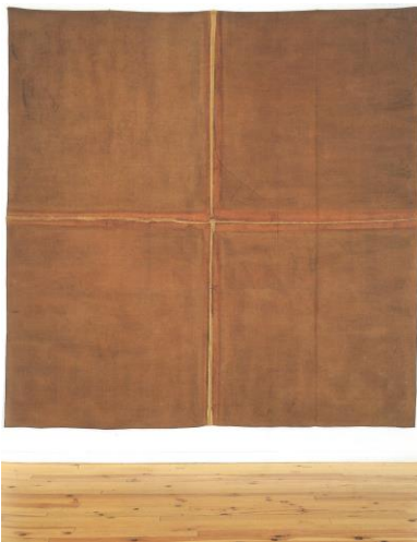
N DOLLA - 1973