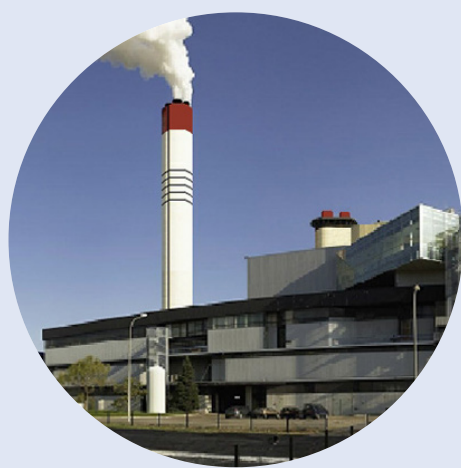
SETMI Usine d'incinération toulousaine