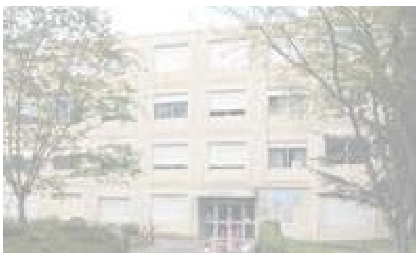
Consultation des « Pathologies Médicamenteuses et de Pharmacovigilance » au CHU de Toulouse

A la demande de leur médecin, les patients ayant présenté un effet indésirable médicamenteux résolu ou non résolu peuvent être pris en charge en consultation.