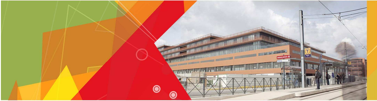
CENTRE D'ENSEIGNEMENT ET DE CONGRÈS Hôpital Pierre-Paul Riquet Site de Purpan Allée Jean Dausset 31300 Toulouse