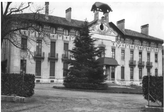
Hôpital Purpan – entrée.

La première pierre de l'Hôpital de Purpan