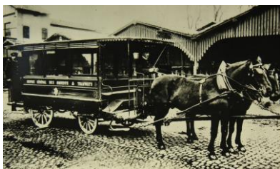
Les véhicules Ripert

Démobilisé, Firmin Pons prend les rennes de l'entreprise de son père. En 1882 les premiers véhicules vont circuler : les Véhicules hippomobiles Ripert . Chaque voiture était tirée par deux chevaux. Une quarantaine de voitures sont mises en service en 1882. En 1886, l'effectif global atteint plus de quatre vingt véhicules.