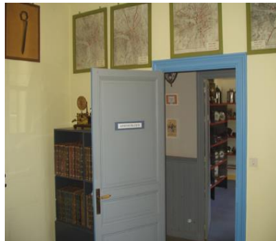
Musée des Transports – salle des plans