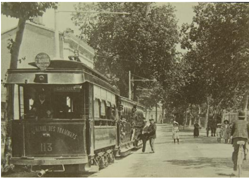
Tramways électrifiés

En 1921, la société de Firmin Pons va devenir la société des transports en commun de la région toulousaine. Enfin en 1926, on assiste progressivement à la disparition des tramways et à l'apparition des autobus sur le réseau suburbain.