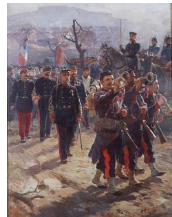
Les artilleurs quittent Belfort – Rixens Salle des Illustres – Hôtel-de Ville

A partir de 1887 on transforme ce réseau : les tramways hippomobiles arrivent sur rail et circulent dans Toulouse progressivement et remplacent les lignes Ripert qui disparaissent en 1913. En 1891 a lieu la transformation la plus importante pour le tramway : l'électrification . La mise en place des rails augmente le confort et la rapidité des transports. Firmin Pons va apporter ses terrains, ses constructions, la voie ferrée, le matériel roulant, plus de sept-cent chevaux avec équipements.