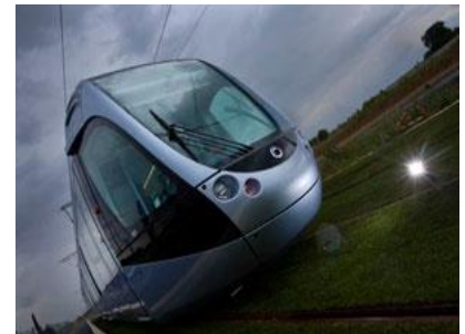
Le nouveau Tram toulousain