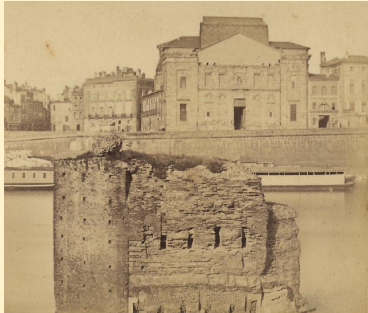
La pile de la Chapelle en 1868