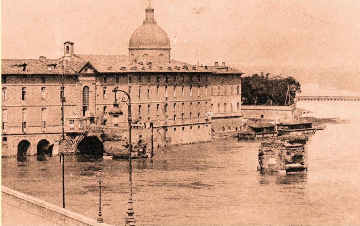
Le Pont neuf et l'Hôtel-Dieu Saint-Jacques par jour de grande presse. Carte postale 1906 (détail).

En 1916 , un projet d'aménagement de la Garonne prévoit la destruction de l'Hôtel-Dieu, de La Grave, du Pont neuf accusés de former un étranglement favorisant les inondations ! Le projet n'aboutira pas.