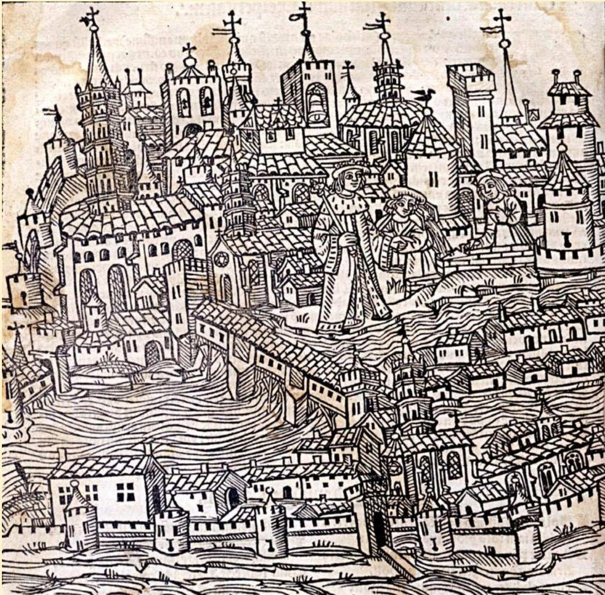
Civitas Tholosa, Nicolas Bertrand, 1515. Gravure sur bois.