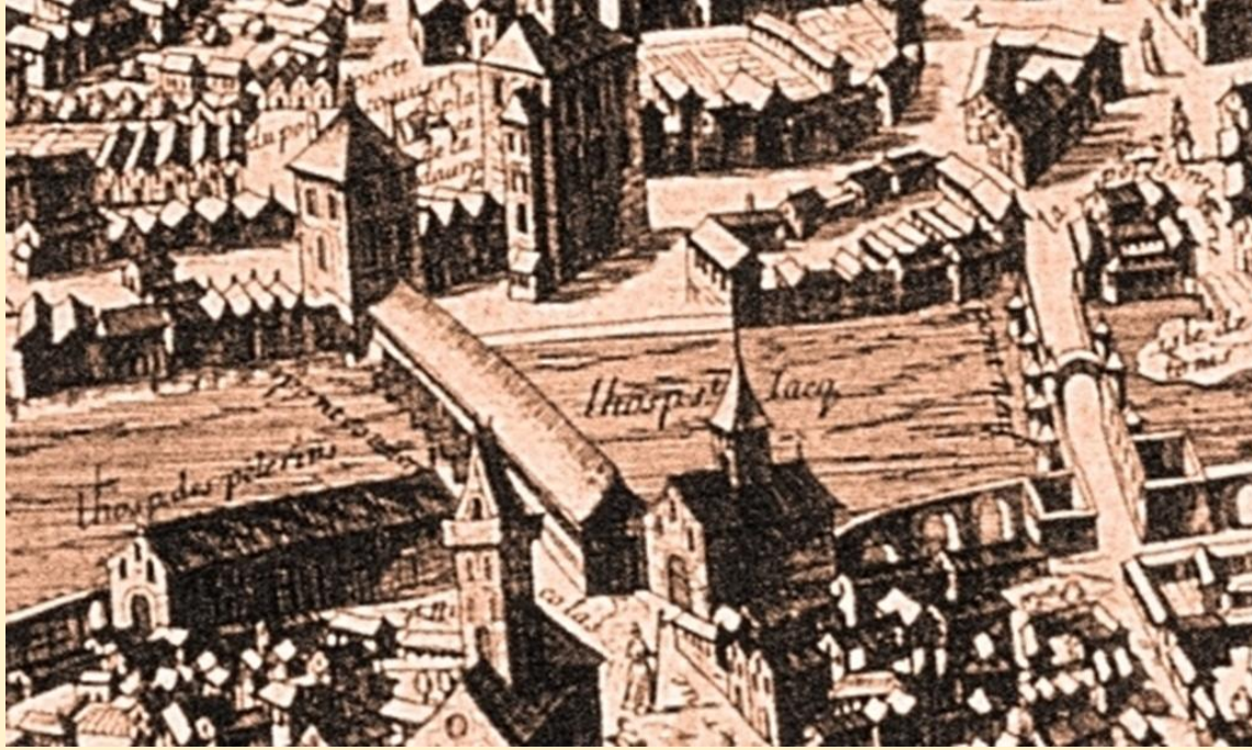
Plan de Tholose. Nicolas Berrey 1663. Eau-forte. Musée Paul Dupuy (détail)