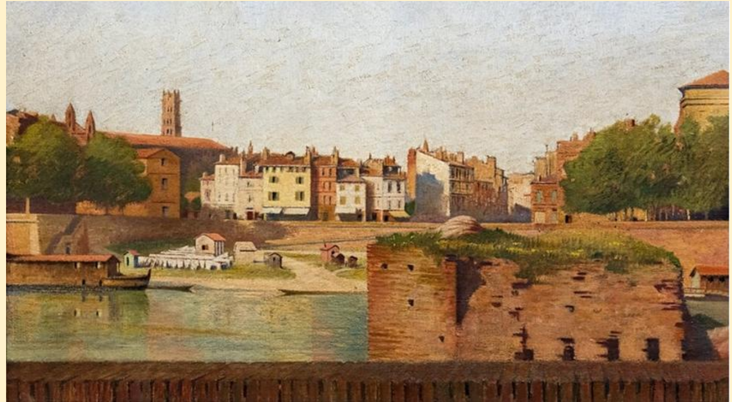
Etude des bords de Garonne avec la pile du vieux pont couvert de la Daurade. Huile sur toile d'Henri Rachou, 1902. (Coll. Particulière.)

En 1558 , un système de bacs est mis en place pour « passer promptement les marchandises », signe que l'état du tablier du pont ne devaient plus que permettre le passage des piétons.... Ce qui est définitivement le cas en 1562.