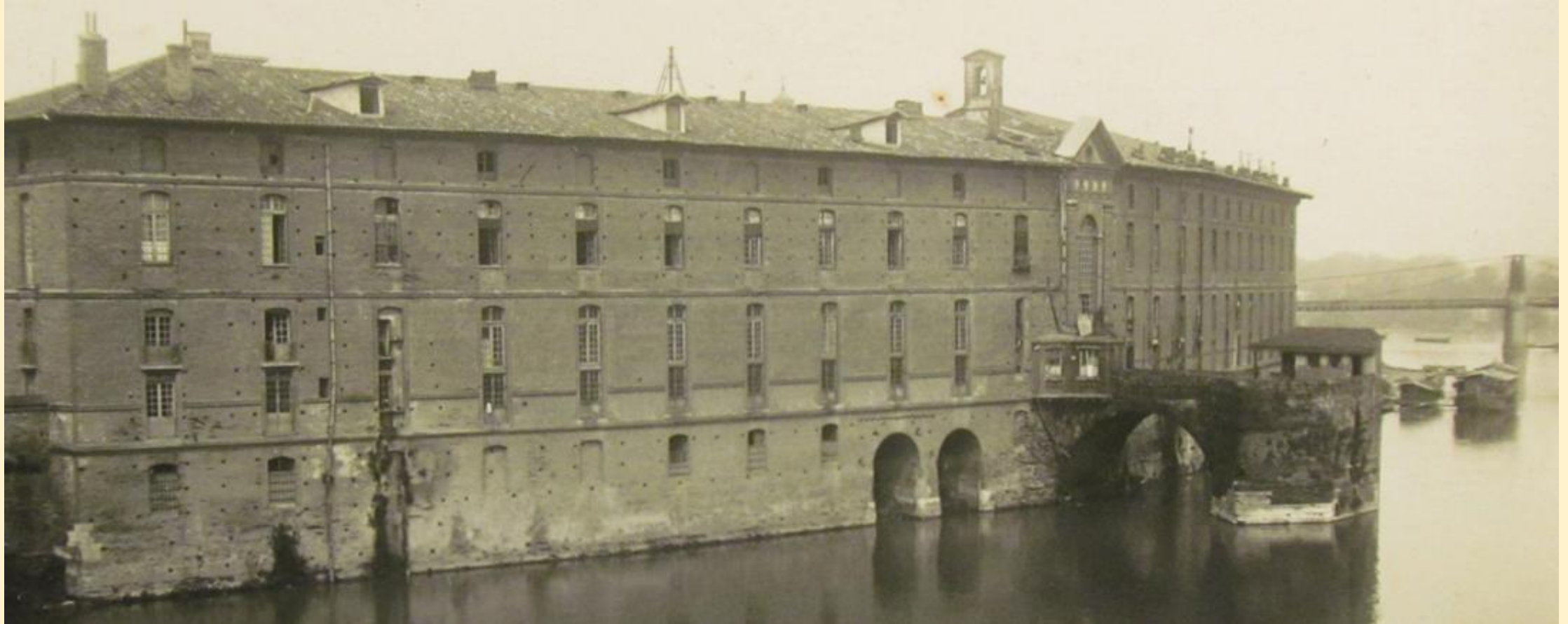
La façade Garonne et la pile du Pont de la Daurade, en 1922 Les constructions sont encore visibles sur la pile.

Ces constructions sont rasées au cours de la seconde moitié du XXème siècle.