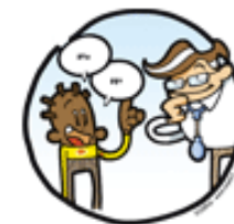
LE MEDECIN ECOUTE

Si tu dis oui, dis-le à tes parents. Tu as le droit de changer d'avis quand tu veux.