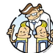
LE LIBRE CHOIX