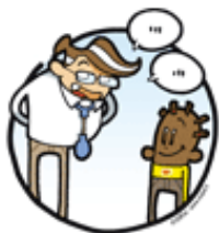
LE MEDECIN INFORME

Ton médecin te propose de participer à une recherche dans le centre où tu es suivi pour ta maladie.