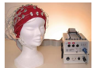
Photographie du système d'enregistrement EEG utilisé.

N.B. La méthodologie proposée n'entraîne pas d'atteinte de l'intégrité physique des participants. Elle est non invasive, indolore et sans risque prévisible.